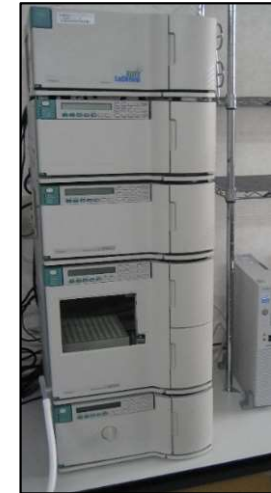
高速液体クロマトグラフ