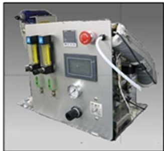
ガス定常発生装置