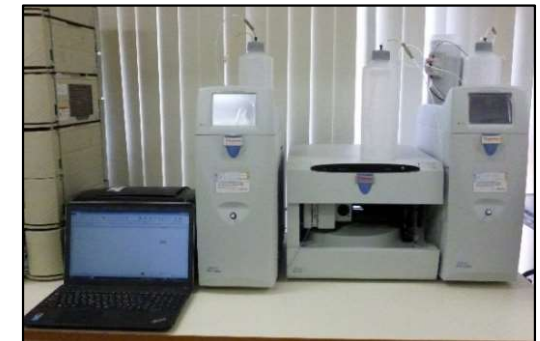
イオンクロマトグラフ

■対象物質の例：アンモニア、硫化水素、SO 2 、NO 2 、トルエン、ホルムアルデヒド、アセトアルデヒド、その他酸性ガス、塩基性ガス、VOCガスなど