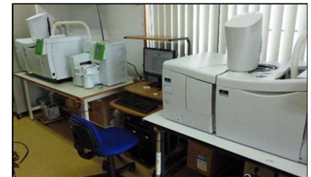
ガスクロマトグラフ/質量分析計

■対象物質の例：アンモニア、硫化水素、SO 2 、NO 2 、トルエン、ホルムアルデヒド、アセトアルデヒド、その他酸性ガス、塩基性ガス、VOCガスなど